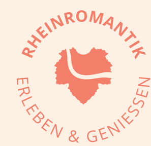
RHEINROMANTIK ERLEBEN & GENIEßEN